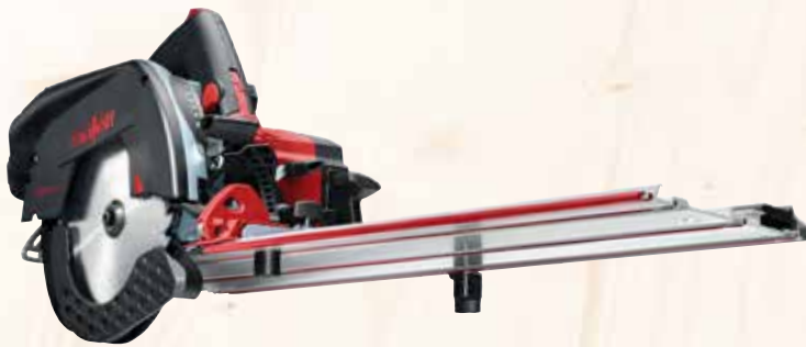
Kappschiene-Säge KSS 50 cc im Transportkoffer Art.Nr.: 918902