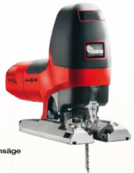
Präzisionsstichsäge P1 cc MaxiMAX im T-MAX Art.Nr. 917103