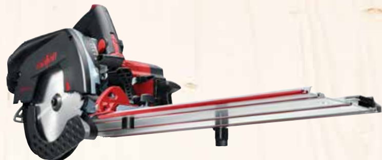
Kappschiene-Säge KSS 50 cc Art.Nr.: 918901