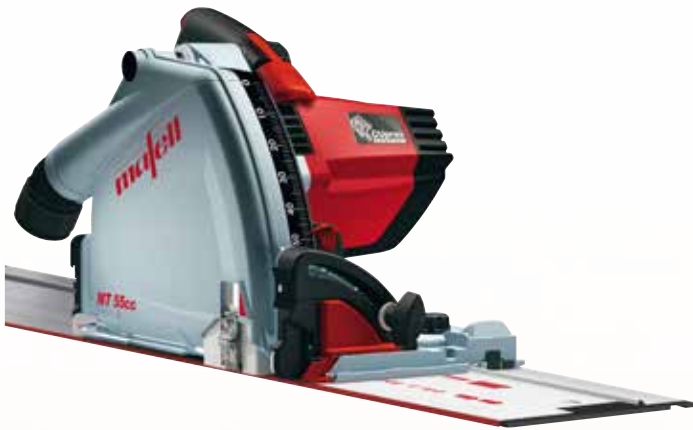
Tauchsäge MT 55 cc MidiMAX im T-MAX mit F 160 Art.Nr.: 917613